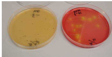
図 1 ▶ ベアードパーカー寒天培地（左）と卵黄加マンニット食塩寒天培地（右）での黄色ブドウ球菌の培養

平成 27 年 7 月に公定法が改正され、ISO 法と整合性のある試験法となっています。