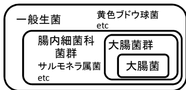
▲ 図 3 一般生菌と腸内細菌科菌群、大腸菌群、大腸菌の関係

腸内細菌科菌群とは、特定の菌ではなく、大腸菌やサルモネラ属菌を含むいくつかの細菌の総称であり、EU 諸国では大腸菌群に代わる衛生指標菌として汎用されています。