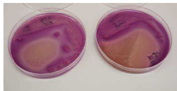
▲ 図 4 VRBG 培地による大腸菌 (左) とサルモネラ属菌 (右) の培養