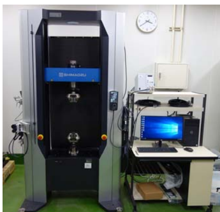
図1 精密万能試験機

また、本装置では専用の治具（図2）を用いることで、二軸引張試験を行うことが可能です。通常の引張試験では試験片を1方向に引張ることで試験を行いますが、二軸引張試験では2方向へ同時に引張ることで、実際の製造工程でかかる負荷に、より近い状態を再現することが出来ます。