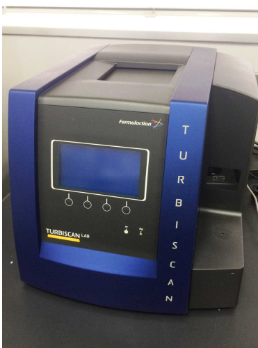
写真 液中分散安定性評価装置

セルロースナノファイバーの繊維形態の評価は、通常、透過型電子顕微鏡や原子間力顕微鏡などで行いますが、当センターが導入した「液中分散安定性評価装置」を活用すれば、セルロースナノファイバーの沈降特性から繊維の形態を簡易的に評価することが可能です。