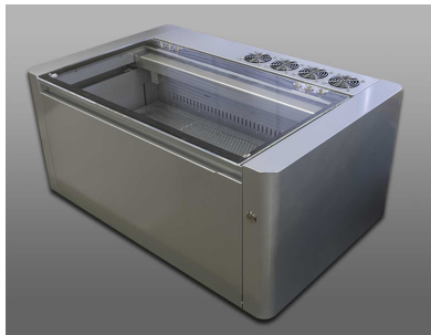
図1 レーザー加工機 (Podea 製 ZERO Corsa)