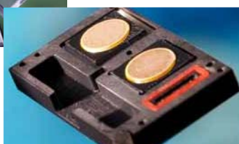
2つのポンプと気泡除去機構を備えたマイクロ流体デバイス ▶