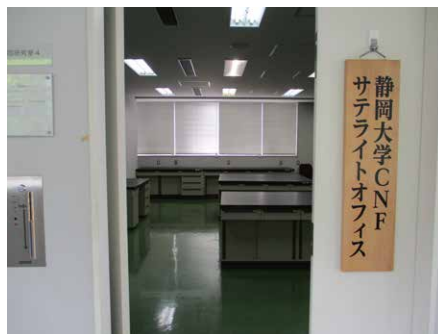
静岡大学CNFサテライトオフィス