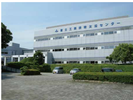
富士工業技術支援センター