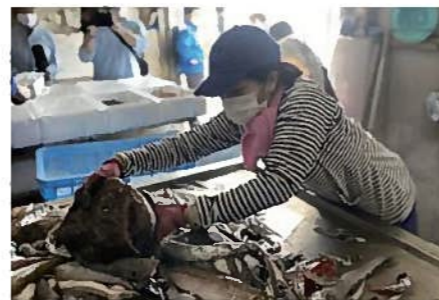
2021年 大賞 ヘンテコ深海魚便

※デザイナーの所属は県内外・社内外・団体内外を問わない ※過去当事業に応募したものは対象外。ただし、改良したものは対象とする ※同一の応募者であっても、コンセプトが異なるものであれば複数点応募可 ※他の選定事業やコンペに応募したのも応募可