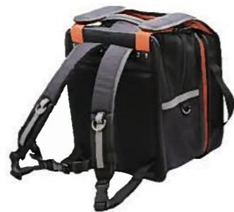
2021年 金賞 ウクラン