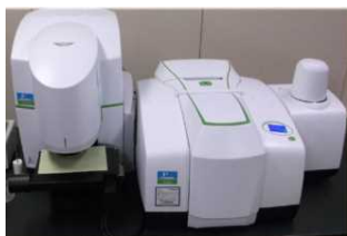
(写真) 顕微鏡付フーリエ変換赤外分光分析装置