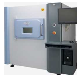
(写真) マイクロフォーカスX線透視装置