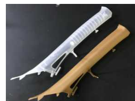
(写真) 成形した自動車部 上：PP、右：PP/CNF複合材

ポリプロピレン（PP）/CNF複合材の力学的特性は、PPの形態によりいくつかの異なる点があることを見出し、物性発現のメカニズムを解明しました。その結果、ホモPP/CNF複合材を改質することにより耐衝撃性のさらなる向上を図り、自動車部品の試作を行いました（協力企業：日本プラスト㈱）。