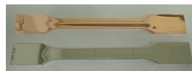
めっき試作品 (上:Cuめっき、下:Niめっき)

セルロースナノファイバー(CNF)を1~20%添加したPP/CNF複合材へのめっき作製条件を検討し、析出性及び外観の良好なダンベル形状のめっき試作品を作製しました。