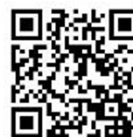
機器データベース （二次元コード）

研究所・各支援センターで保有している機器をお知りになりたい場合、機器データベース（ https://www.iri.pref.shizuoka.jp/equipment ）からお調べ頂けます。データベースでは、お調べになりたい機器の名称等（部分的でも可）を入力して頂くと、当研究所で保有する機器の情報を検索することが出来ます。