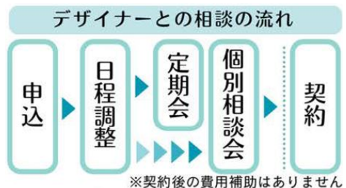
図 デザイン相談会実施の流れ

お問い合わせ先 静岡県工業技術研究所 ユニバーサルデザイン科 電話 054-278-3024