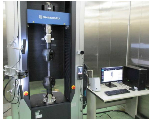
図1 精密万能材料試験機（本体と制御PC）