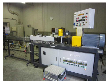
(写真) 二軸混練押出機