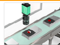
(成果利用波及先イメージ図) 非接触・非破壊検査装置

THz波計測によるCNF樹脂複合材中のCNF濃度とTHz波の吸収係数の間に高い相関関係があることを確認し、THz波を利用し、CNF分散性の違いを非破壊で評価できる可能性を見出しました（共同研究企業：浜松ホトニクス(株)）。