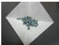
再生プラスチックペレットの例

なお本研究は、環境省・（独）環境再生保全機構の環境研究総合推進費（JPMEERF20253RB1）により実施しています。