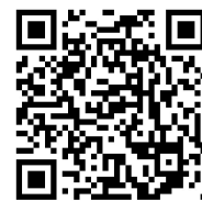
研究所HP 刊行物ページ

県内中小企業の方や県民の方に向けて、研究成果や技術の紹介などの技術情報を提供しています。「研究報告書」のほか、専門外の方にも理解しやすいようにまとめた「研究成果事例集」、最新技術の解説や研究機器を紹介する「工業技術情報」など、研究所HPに掲載しています。こうした情報発信により、研究成果の普及と県内産業での利用促進を図っています。是非御覧ください。