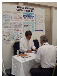
(写真)展示会でのものづくり産業支援窓口の様子