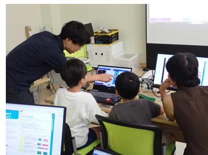
(写真)令和7年度 施設公開の様子

県民の皆様には研究所の業務を広く知っていただくために「工業技術研究所施設公開」を開催します。当研究所が所有する研究機器等の見学を実施します。