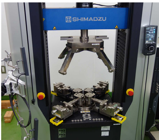
図1 二軸引張試験機